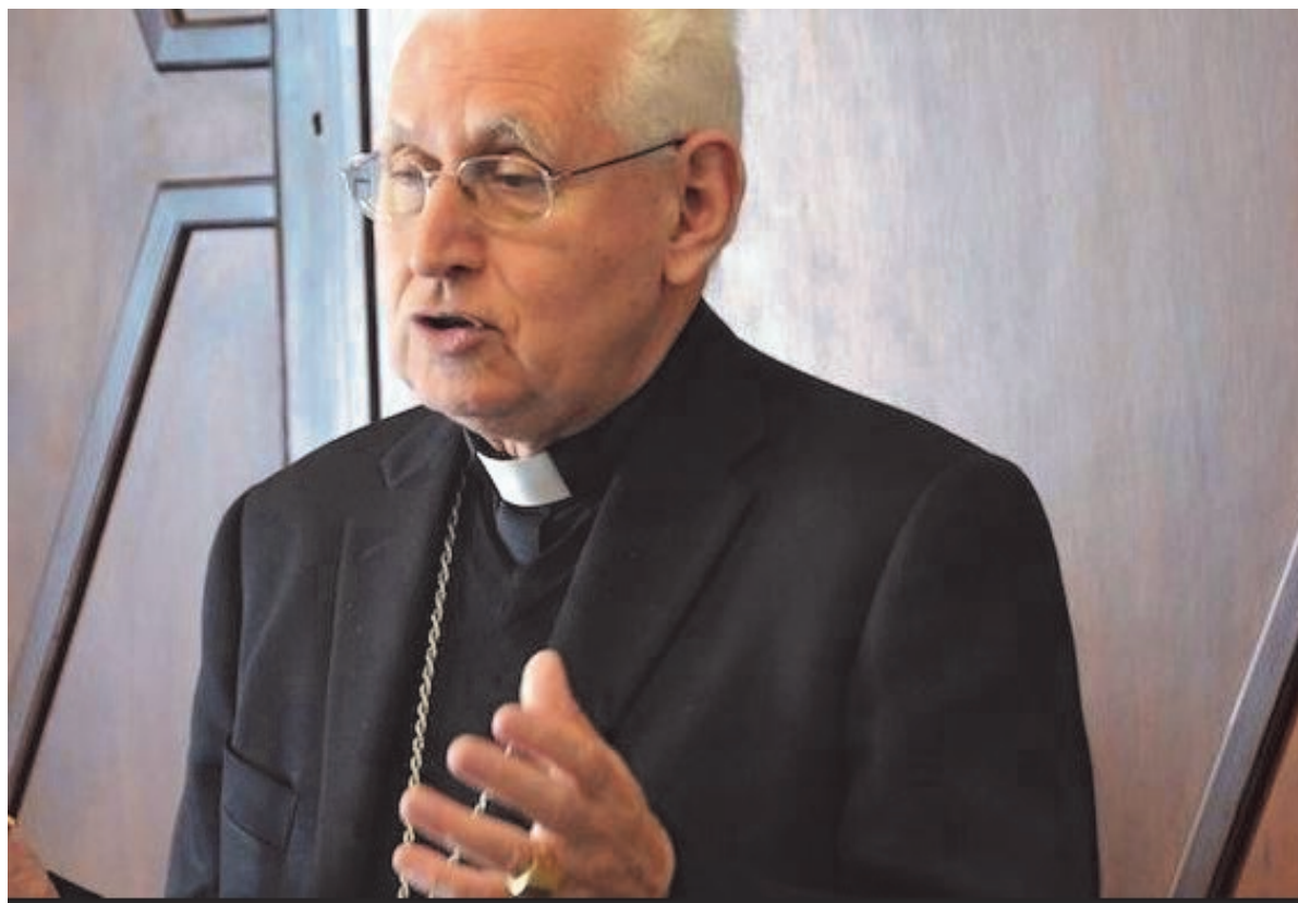
In modo più alto degli altri Giovanni ha trasmesso alla Chiesa i misteri rivelati da Dio

Non vi dico le email che mi sono giunte dai gatti siciliani, da sempre particolarmente devoti alla eroina Lucia, menzionata assieme all'eroina catanese Agata in quel Canone Romano della Santa Messa che non risulta neppure nel Missale Proprio dei Santi e delle Sante di Sicilia, il quale si limita a riportare solo la II e la III Preghiera Eucaristi-