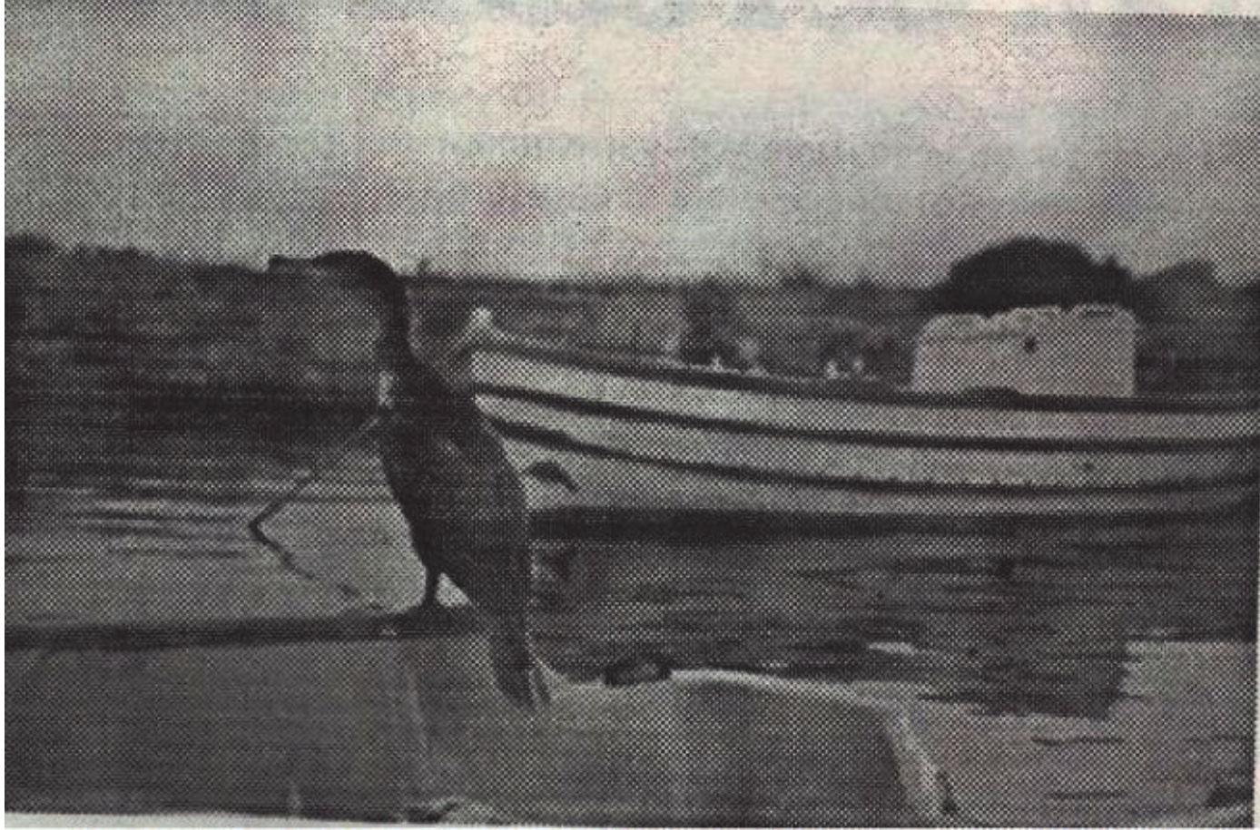
Questo è il cormorano che si vide allora; da allora non se ne sono più visti!