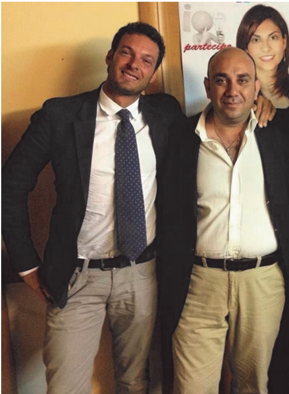
riqualificazione del Viale Tisia e Via Pitia, lo spostamento della caserma dei vigili urbani in via Algeri con riqualificazione delle

Scriviamo il 7 giugno scorso: Revocato il decreto di finanziamento Cipe che prevedeva fondi per la riqualificazione e il recupero di Siracusa. Con decreto 001086 del 5 giugno scorso infatti, la Regione ha revocato il finanziamento di sette milioni e mezzo per il comune di Siracusa. Se non è un colpo mortale per la città poco ci manca. La responsabilità è esclusiva della Garozzo Band e del sindaco e vicesindaco in prima persona visto che la revoca avviene dopo ben 5 solleciti al Comune dell'assessorato alle infrastrutture della Regione che sono stati ignorati. Insomma, per colpa evidente, questi signori hanno tolto alla città sette milioni e mezzo per asfaltare strade e ridare dignità alle periferie e dare anche uno sbocco occupazionale non indifferente. Scriveva Giancarlo Garozzo il 7 marzo 2017: "Approvata dal governo nazionale la delibera cipe, per la riqualificazione delle periferie, in arrivo a Siracusa svariati milioni di euro tra i vari progetti finanziati la